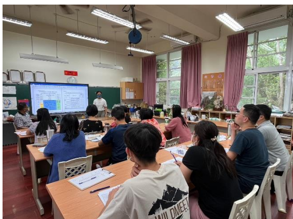
112 學年第一次課發會